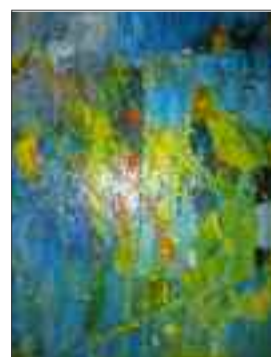
Giselle Thommen Oel/Acryl