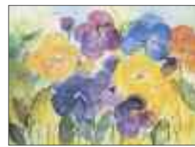
Gisela Capitelli Blumengarten