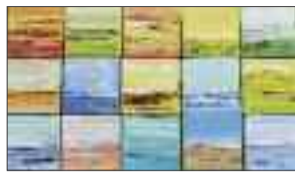
Eliz Bütikofer-Mendes Horizonte