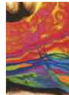
Léa Pasqualini Farbe und Klang www.sound-of-color.com