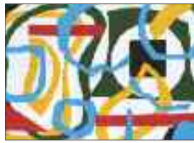
Oskar Pache Scherenschnitte